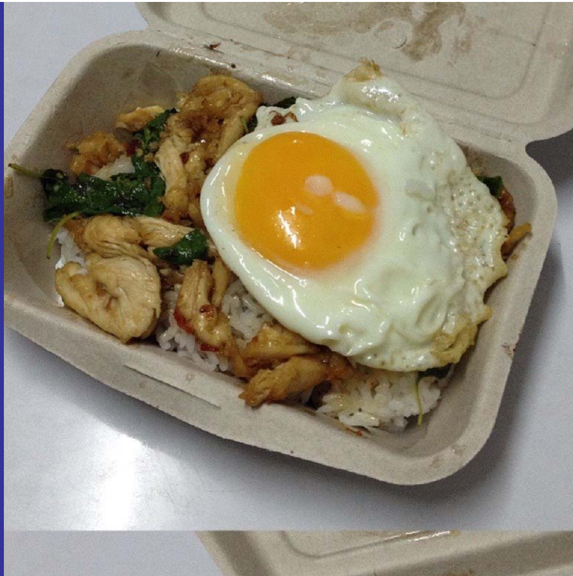
กะเพราไก่ไข่ดาว ใส่กล่องชานอ้อย ราคา 50 บาท